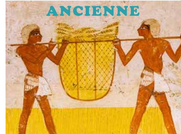
Création ADEC M. Frère mai 2017 - Tombe de Menna (TT 69)